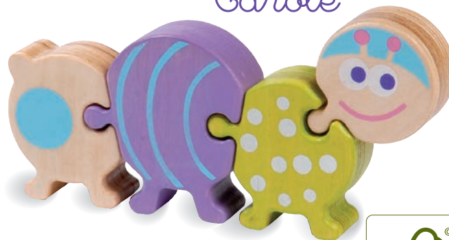
Gaston the Hedgehog Gaston le Hérisson 8505 +18m