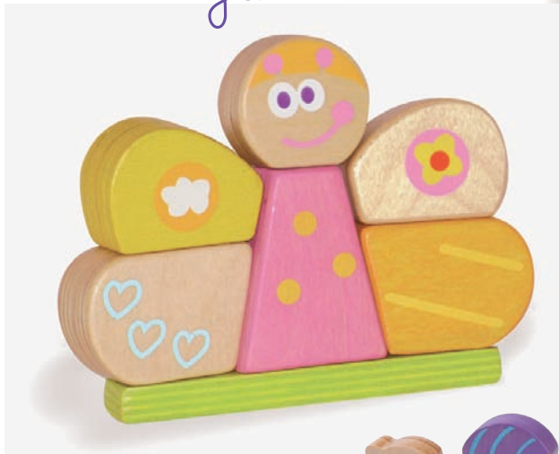
Julie the Butterfly Julie le Papillon 8504 +18m