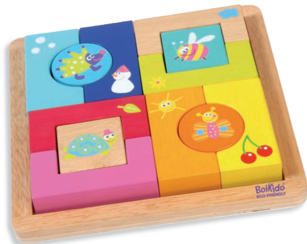
4 Seasons Block puzzle Puzzle 4 Saisons 8501 +24m