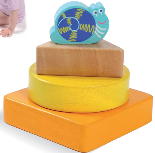
Stacking Snail Eric Eric l'Escargot à Empiler 8509 +18m