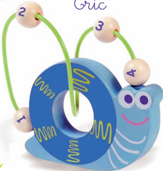
Eric the Snail Eric l'Escargot 8502 +18m