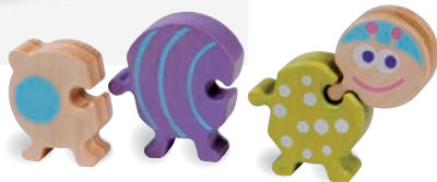
Carole the Caterpillar Carole la Luciole 8506 +18m