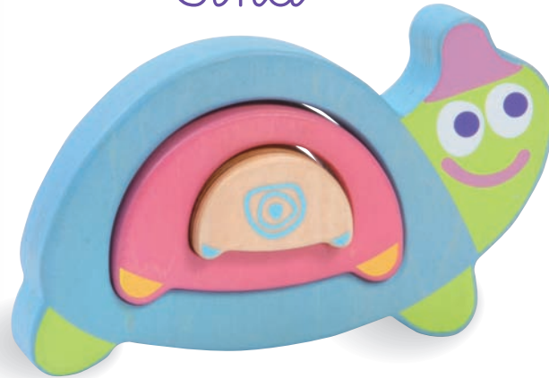
Tina the Turtle Tina la Tortue 8503 +18m