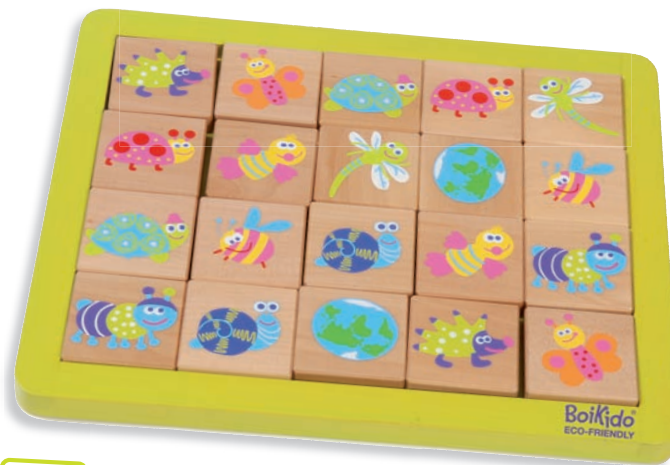
Memo Game Jeu de Mémó 8507 +24m