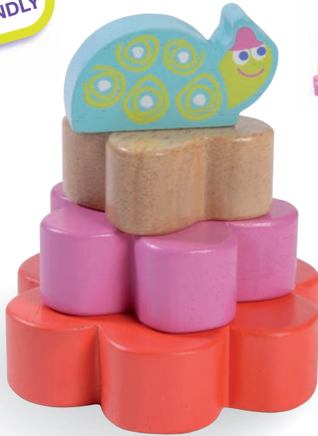
Stacking Turtle Tina Tina la Tortue à Empiler 8508 +18m