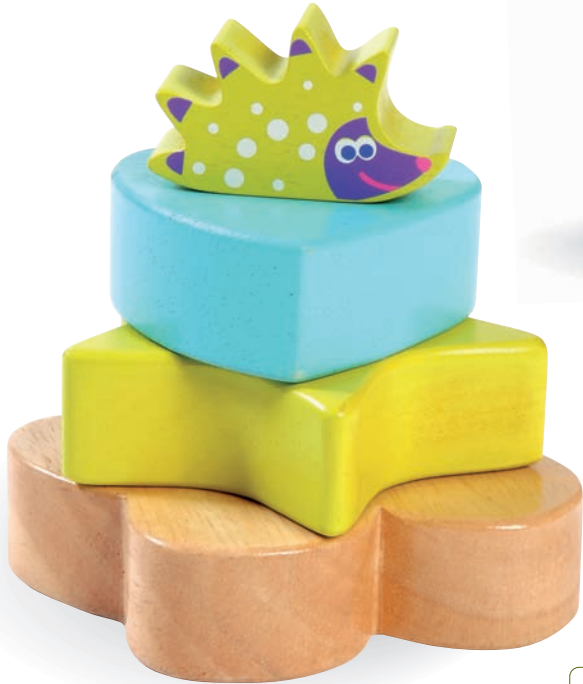
Stacking Hedgehog Gaston Gaston le Hérisson à Empiler 8510 +18m